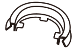
El diámetro del orificio interior es de 34 mm.